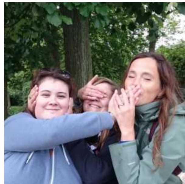
Zeer vaak; horen zien en zwijgen!