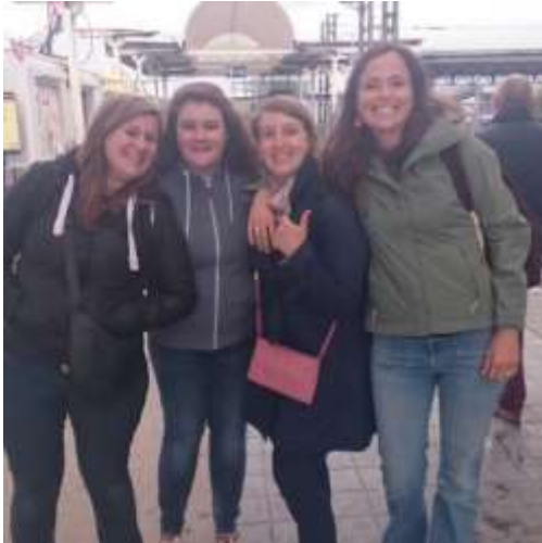
Bij start van het spel; een teamfoto nemen

We geven jullie een Sneek Peek van de uit te voeren opdrachten met fotomateriaal. Het video materiaal zullen we jullie besparen 😊