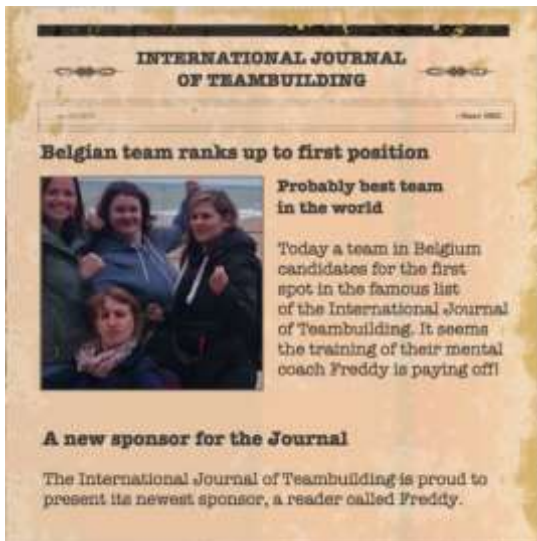
Zwalmnest team aan de top!